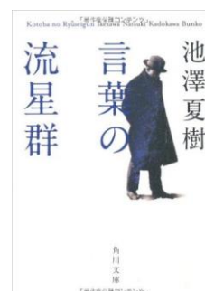
『言葉の流星群』(角川文庫)

28 年前の父の罪を負って娘は逃げる、逃げる。追ってくる相手はあまりにも大きい——。震災後文学の傑作誕生! 「核」をめぐる究極のポリティカル・サスペンス!!